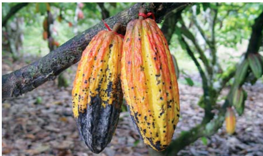
Mazorcas de cacao atacas por chinchas.

medianas y grandes (>10 cm largo). Lo mismo ha sido observado en la zona atlántica de Costa Rica (Donis y Saunders 1997).