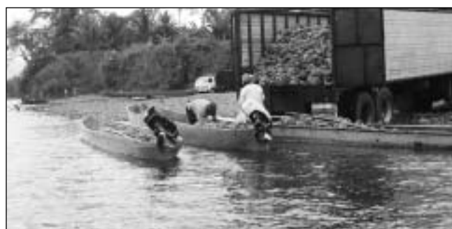
Productores de banano orgánico en los territorios indígenas de Talamanca, Costa Rica.

(Theunissen 2003). El programa de banano dentro del comercio justo empezó en 1997, siendo el banano la primera fruta fresca en venderse dentro de este nicho de mercado. Actualmente existen 12 organizaciones productoras registradas en Ecuador, Colombia, Costa Rica, Ghana, República Dominicana y las Islas Barlovento (Chambron 2001; Ramírez 2001b). La comercialización de banano dentro del comercio justo ha tenido un crecimiento de 20 a 30% por año entre 1997 y el 2000, pasando de aproximadamente 12000 a 23000 t en este periodo (Ramírez 2001b). Los principales mercados para el banano "justo" son Suiza, Holanda y Reino Unido (Chambron 2001).