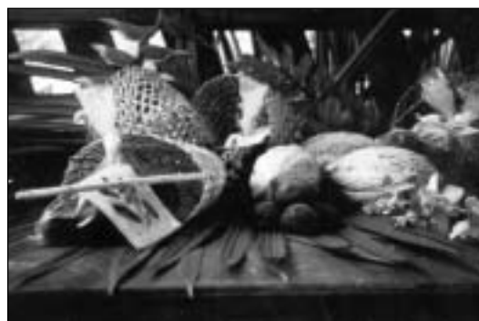
Cacao orgánico y algunos derivados producidos y comercializados por indígenas de Talamanca, Costa Rica.

cacao orgánico condujo a precios bastante elevados en 1992 y 1993. Como consecuencia, hubo un rápido crecimiento de la oferta, acompañado por una reducción del sobrepuesto a partir de 1994, dado que la oferta creció más rápidamente que la demanda. Eso refleja un proceso de maduración y consolidación del mercado del cacao orgánico.