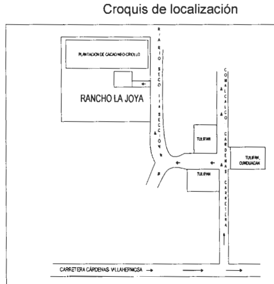
Figura 2. Hacienda La Joya, Ranchería río seco 1 ra sección, Cunduacan Tabasco.